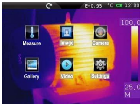
Obecná nabídka s ikonami

Model THT60 je profesionální infračervená kamera s barevnou kapacitní dotykovou TFT obrazovkou pro rychlé a intuitivní pokročilé použití jakýmkoliv termografickým operátorem