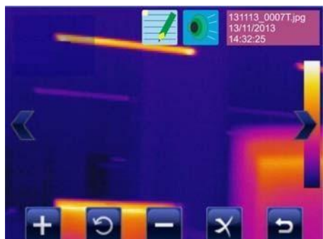
Vokální a textové anotace