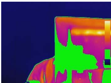
Pokročilá analýza: funkce isotherm