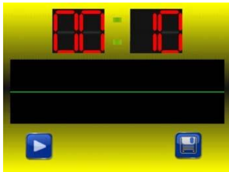
Vytváření IR videa