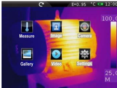
Obecné menu s ikonami

Model THT60 je moderní infračervená kamera s kapacitní barevnou dotykovou obrazovkou TFT pro rychlé a intuitivní ovládání